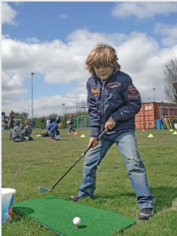
Nooit te jong...

Stichting BOON gesloten: Stichting BOON is jaarlijks de week van 25 december t/m 1 januari gesloten.