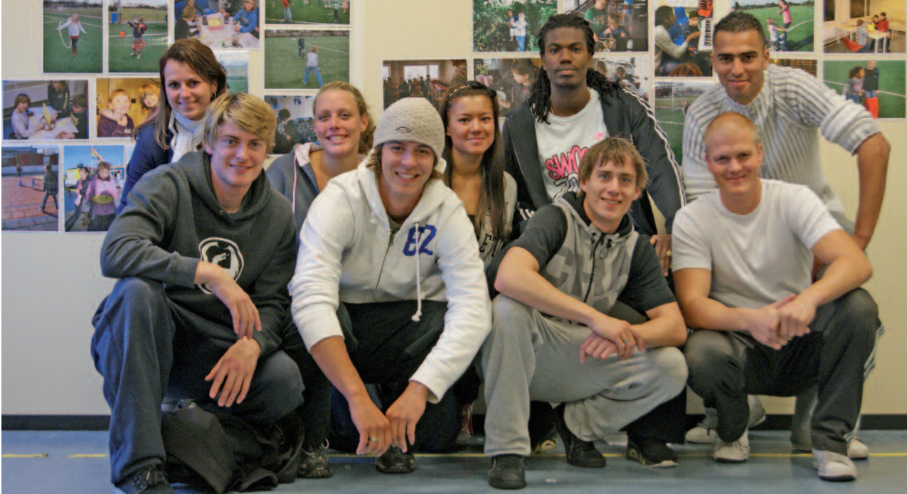
Het team van Boon-Escapade