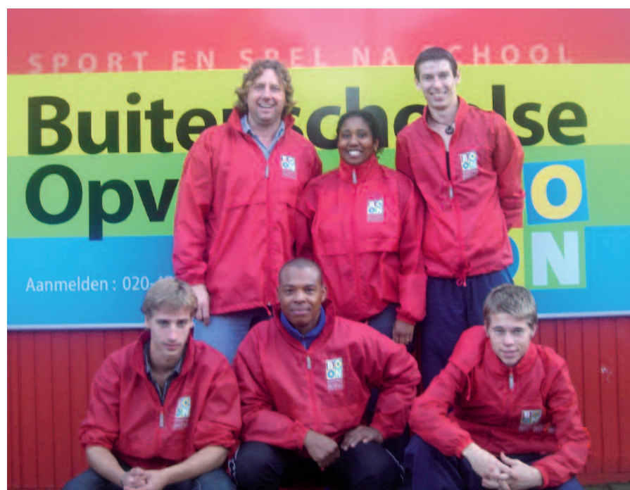
Het team van Boon-De Meerkamp